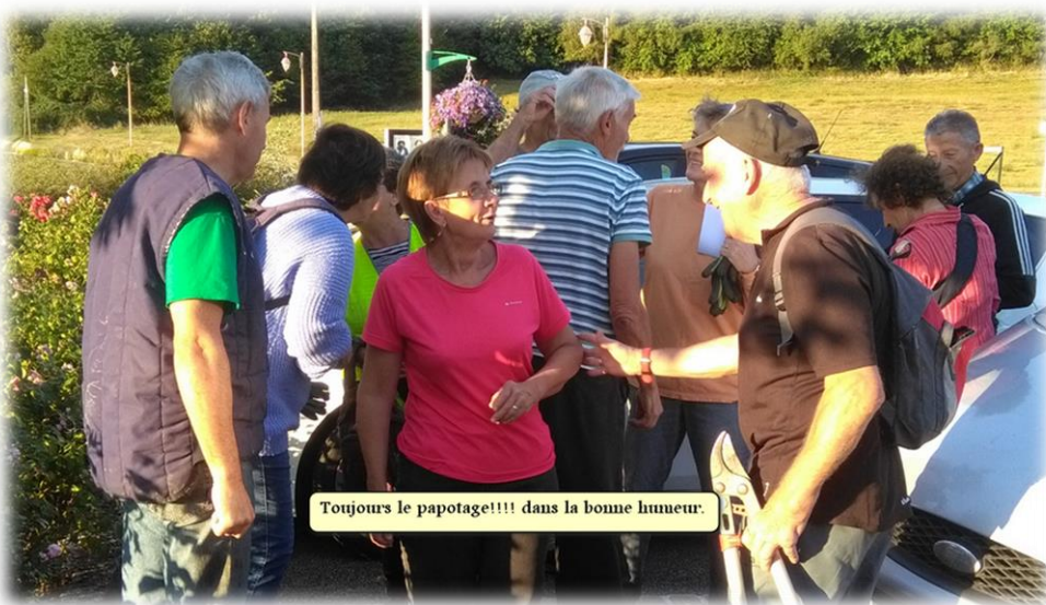
Toujours le papotage!!!! dans la bonne humeur.