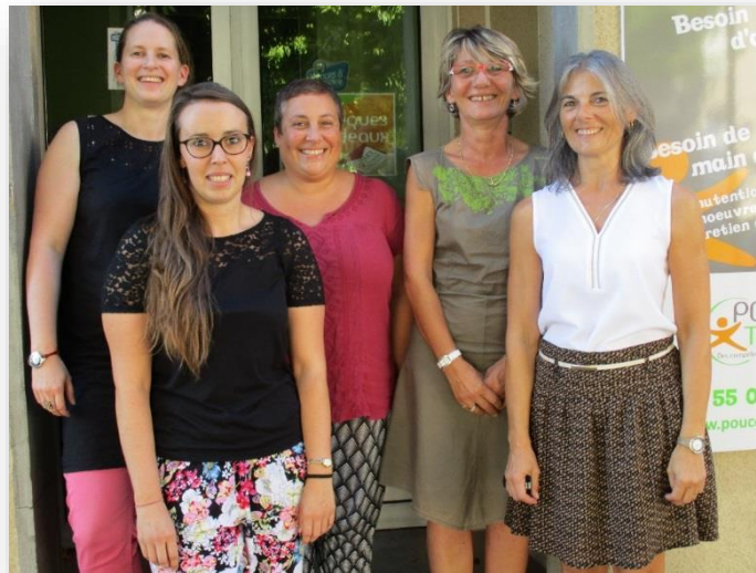
de gauche à droite

Une nouvelle équipe de cinq salariées assure le fonctionnement de l'association :