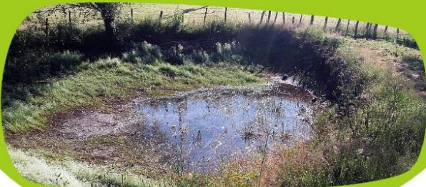
Mare de la commune de Gorre

La préservation des zones humides avec l'implication des communes de Gorre et de Pressignac dans le recensement des mares de leur territoire et des actions de restauration déjà engagées !