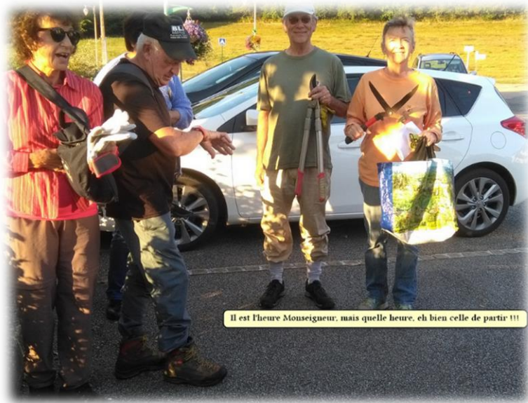
Il est l'heure Mousigneur, mais quelle heure, eh bien celle de partir !!!

La nouvelle boucle du Parc Régional Périgord Limousin faisant environ 200 km, celle-ci a un tronçon de 13,7 km de St-Laurent-Sur-Gorre à Champagnac-La-Rivière.