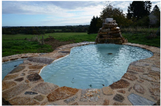
FONTAINE A COTE DE LA PLACE DE LA BASCULE