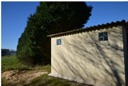
ENDUIT SUR L'EXTENSION DES VESTIAIRES DU STADE