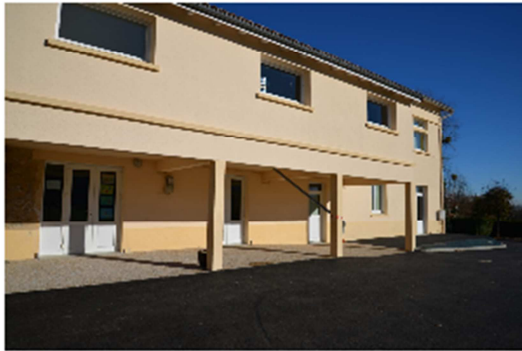
TRAVAUX D'ACCESSIBILITE AU RAM ET SALLES DE REUNIONS SOUS LA SALLE DES FETES